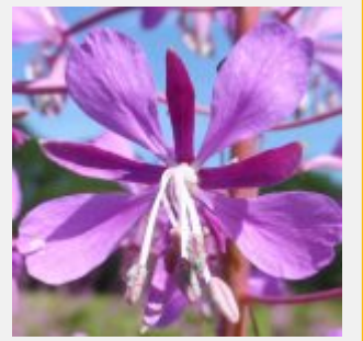
Fleur d'épilobe en épi. (Cliquer pour agrandir la photo)

Sur la photo ci-contre vous pouvez voir que le pollen porté par l'abeille est gris foncé et pourtant en observant les anthères de ces fleurs le pollen ne paraît pas aussi foncé... mais le document cité plus haut confirme bien la provenance de ce pollen.